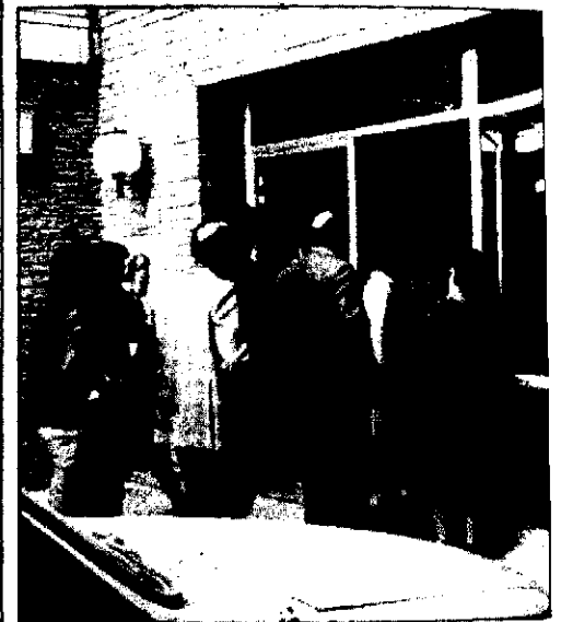
No todos son atendidos en el Ambulatorio

desaparecido el voto hacia la derecha moderada pasando a una derecha reaccionaria y por otro, en la izquierda se ha tendido hacia la concentración del voto útil. En Santa Coloma, ha pasado la misma tónica que en el resto del cinturón industrial. El PSUC ha visto su imagen deteriorada por los períodos dilatados de crisis internas, "estas ha sido un factor tremendo", según su portavoz. El Comité local ha valorado que quizás el PSUC se ha institucionalizado excesivamente y ha de volver a integrarse en el entramado social y prepararse para las próximas batallas políticas.