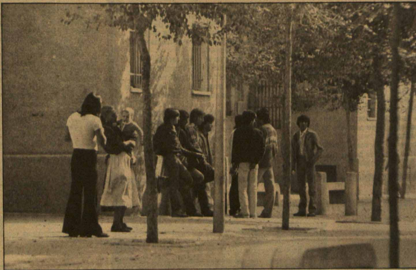
Entenfrentamientos recientes con algunos grupos de jóvenes han exasperado a los vecinos del Congrés

Este accedió a incrementar la vigilancia, pero los vecinos han montado sus propios piquetes de defensa. Para el concejal de gobernación del Ayuntamiento, Juan Felipe Ruiz, "esto sólo ayuda a empeorar el tema, dando una imagen de caos e inseguridad inexistente".