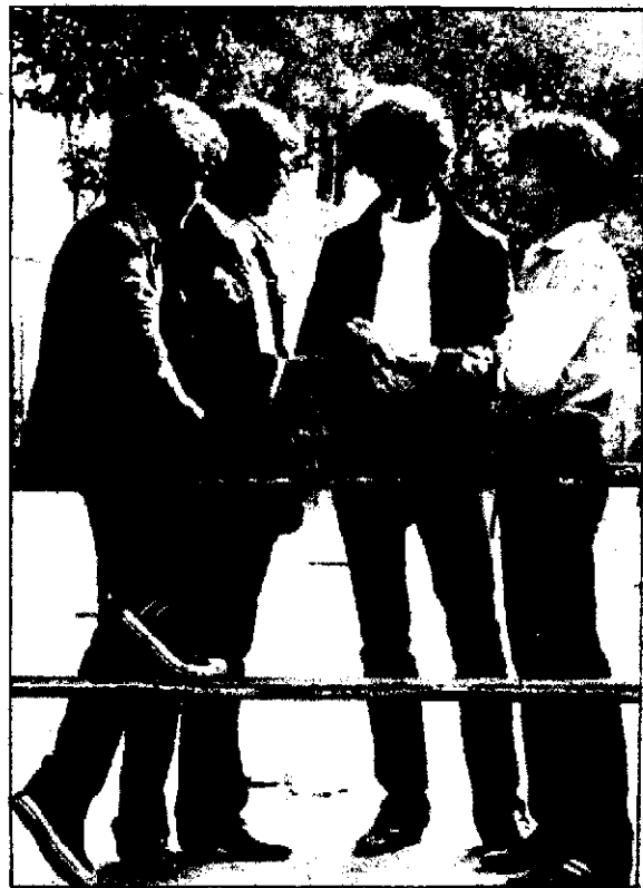
El congreso ha estallado tras una pelea reciente