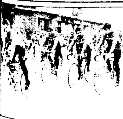
Ciclistas colomenses han acabado la temporada.