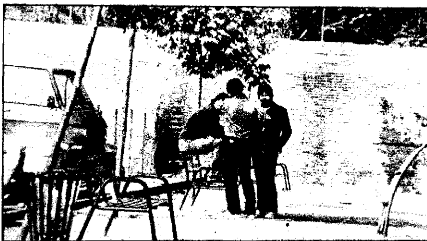
Algunos jóvenes se agrupan en pandillas no siempre pacíficas

Los vecinos, por su parte, dicen que la Guardia Urbana no sirve de nada, porque las pandillas de muchachos se rien de sus agentes. El pasado martes, día 2, se celebró en el Congrès una asamblea de vecinos en la que