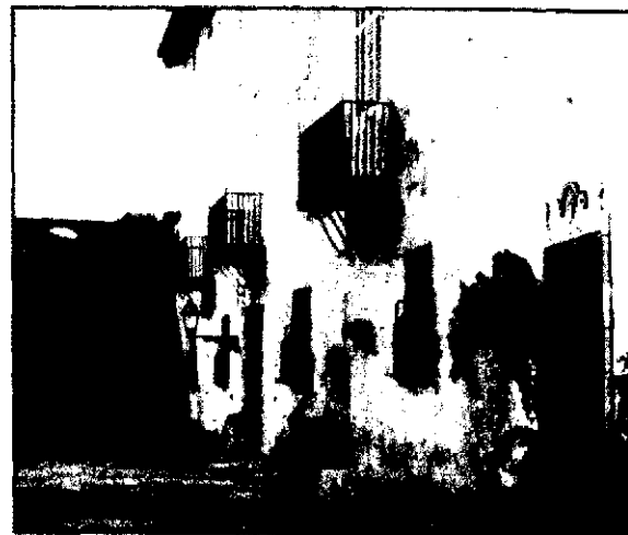
Can Miravitges alberga la Escola de Natura y el Museu de la Pagesia