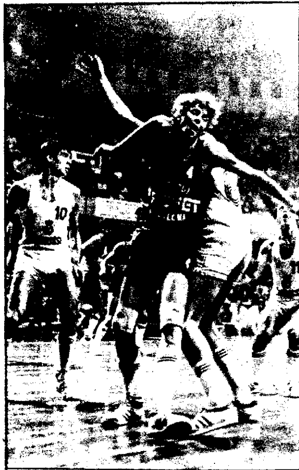
A Jack quieren darle por todas partes

Desmentida la información, la plantilla del Joventut parte esta mañana hacia Santiago donde mañana jugará contra el Obradorio. Una mejora en el precio de tarifa hace adelantar el horario de partida. La Penya entrenará esta tarde en la pista del club gallego. J.M.R.J.G.G.