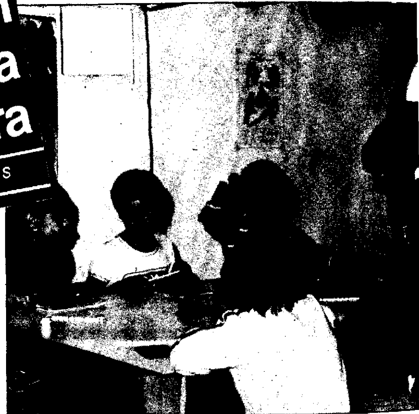
A los más pequeños, se les enseña el entorno natural, jugando