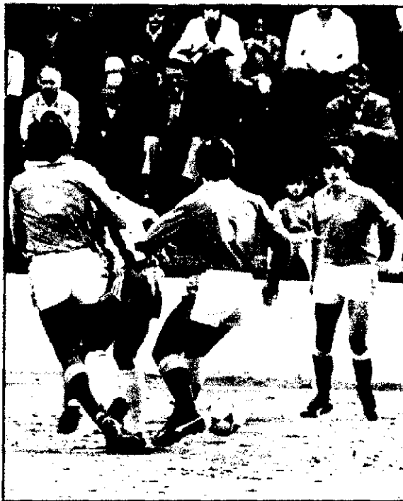
La Gramenet tendrá superioridad de entrada

Joaquín Sauras salió de los equipos inferiores de la Gramenet, fue fichado por el Sabadell en Primera y acabó la pasada temporada en el equipo azulado de donde se le dio la baja por no ascender. Josep Maria Roca