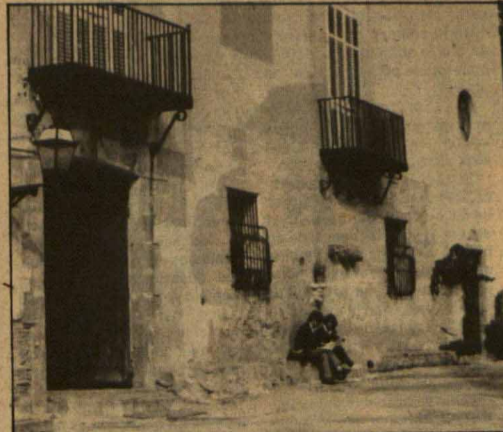
La masia de Can Miravitges