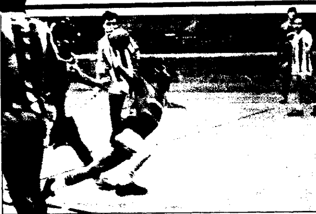
Mingo es de los que seguirán rematando