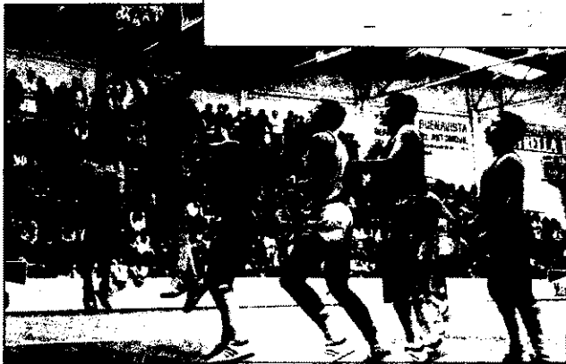
Ignorar los equipos es la meta del nuevo sistema