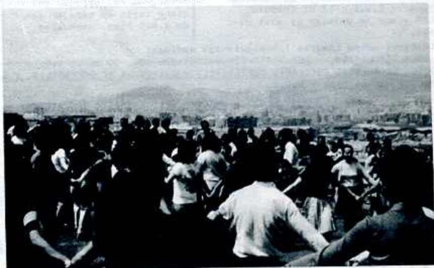
LOS VECINOS BAILANDO SARDANAS

Están previstos nuevos actos, que de no haber prohibiciones por parte de la autoridad gubernativa, se realizarán para distracción de todos los vecinos del barrio.